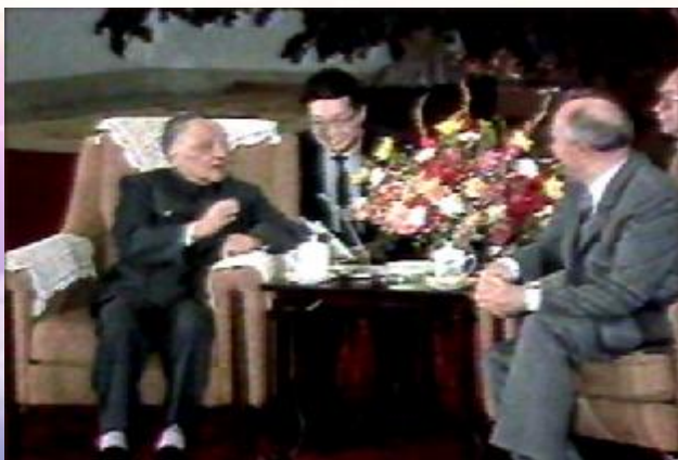
1989年5月16日邓小平会见戈尔巴乔夫

“世界形势日新月异,特别是现代科学技术发展很快,现在的一年抵得上过去古老社会几十年,上百年甚至更长的时间,不以新的思想、观点去继承、发展马克思列宁主义,不是真正的马克思列宁主义者。” ——邓小平