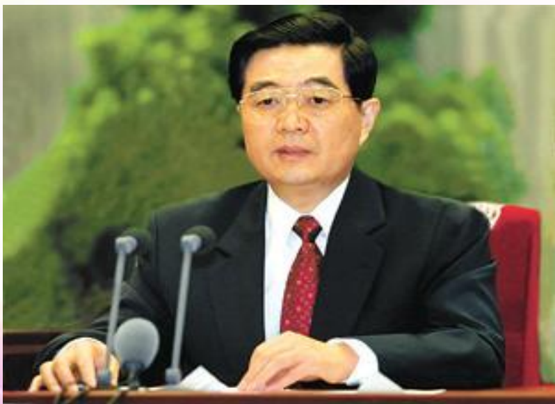
2003年7月1日，“三个代表”重要思想理论研讨会在北京开幕。

“坚持用马克思主义态度学习贯彻好‘三个代表’重要思想，用‘三个代表’重要思想指导新的实践，并努力在实践中继续发展马克思主义。”强调“务必在武装思想和指导实践两个方面都取得新的成效”，提出“我国社会主义的自我完善和发展还有许多重大课题需要进一步探索和回答，还有大量工作需要去做”，列举“如何切实抓好发展这个党执政兴国的第一要务”等一系列重大课题，阐明“‘三个代表’重要思想既是我们推动实践创新的根本指针，又是我们深化理论探索的崭新起点”。